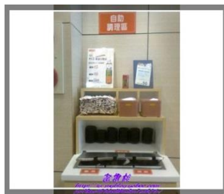
圖 4 自助調味區

轉型後的三商巧福在商品上有了更多的選擇，也會定期舉辦促銷活動，來吸引更多的消費者前來消費。