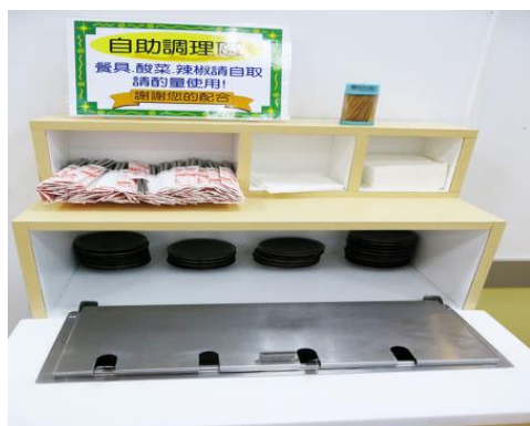
圖 3 自助調味區

此外，桌上的調味料及餐具也有了改變，以往的調味料及餐具都是放在桌上的，顯得不夠美觀，更無法有效率的管理，改建後的三商巧福新建了自助調理區，以便集中控管並使桌面乾淨整潔，整體上顯得更美觀，如圖 3、圖 4。